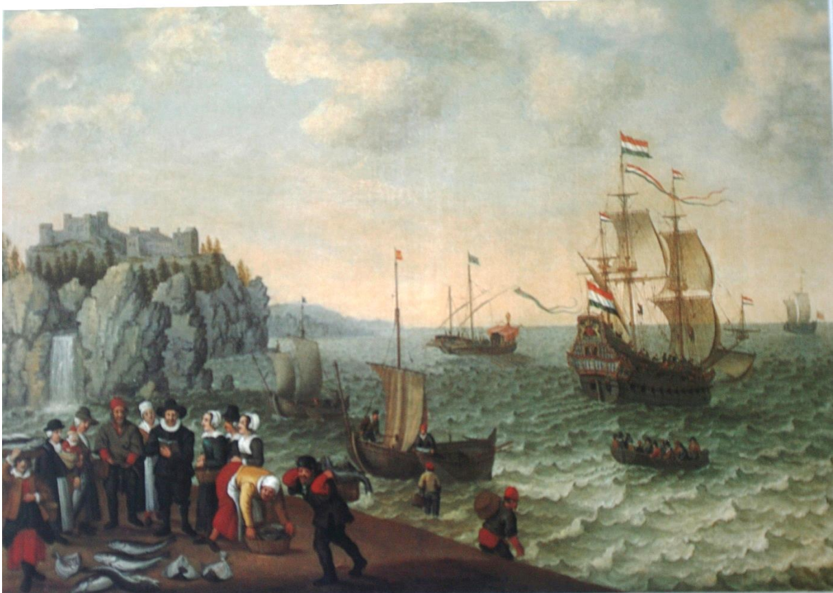
AD Willaerts f, Doek. 65 x 85 cm. De vis wordt aan wal gebracht en verkocht waarbij een man met boek in de hand. Diverse schepen op zee en Dover Castle, ca 1630.

perfectie is hier sprake van een exempel van de bijzondere plek die deze medeoprichter van het Utrechtse schildersgilde heeft ingenomen.