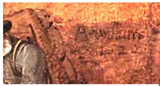
Signering en datering rechtsonderaanast schouder van de arme vaderfiguur

Het kleurenpalet dat kenmerkend is voor de schilderijen uit de zuidelijke Nederlanden met een bruingekleurd premier plan is afgebeeld voor een groenige zee en rechts met een overwegend grijsgroen berglandschap. De zee gaat in de verte geleidelijk over van blauwig in een vage minder heldere blauwgroenige achtergrond waardoor een sterk sferisch perspectief is ontstaan. De wolkenpartij is zoals vaak gedetailleerd en realistisch weergegeven.