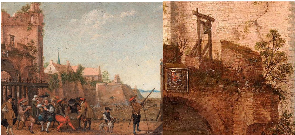
Adam Willaerts toegeschreven aan,, Kaartende burgerwacht voor de Servaas poort, ca 1630

Overigens zijn er van Willaerts vele schilderijen bekend met dit soort poorten die een stad van het strand kunnen afsluiten.