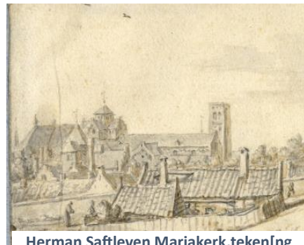
Herman Saftleven Mariakerk, tekening detail

Het leuke van het werk van Willaerts dat hij vaak zoals bij de poort, herkenbare details aanbrengt, met name de bebouwing hoog op de kust laat rechts het exterieur van de Utrechtse Mariakerk zien en boven aan het pad naar boven rijst een toren op die zeer sterk aan de Servaastoren doet denken. Met een beetje fantasie doet het verderop gelegen kasteel denken aan Dover Castle, dat Willaerts mogelijk gezien heeft op zijn reis van Engeland naar de Nederlanden